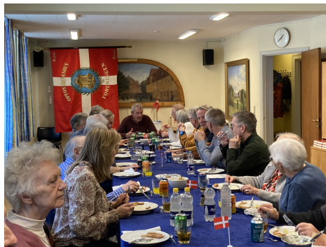
Foto fra fødselsdagsfesten 2025

Pris: Det er gratis for medlemmer, der frit kan medtage én gæst, det være sig konen/kæresten eller en klassekammerat (som ikke er medlem).